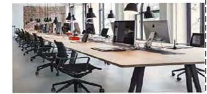
سازمان‌ها و دفاتر کار