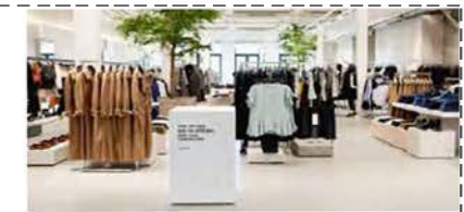
مراکز خرید و فروشگاه‌ها