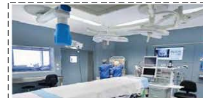
مراکز درمانی و بیمارستان‌ها